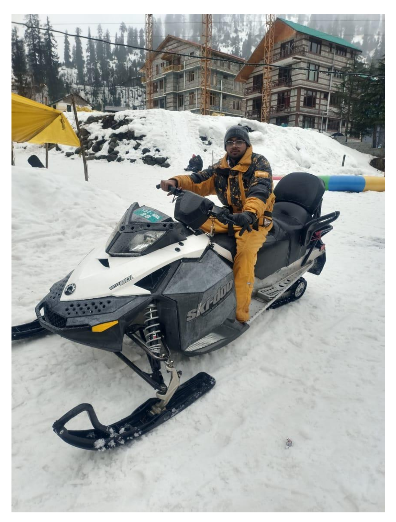
B. Pharm, 8<sup>th</sup> sem student enjoying snow scooter at Manali