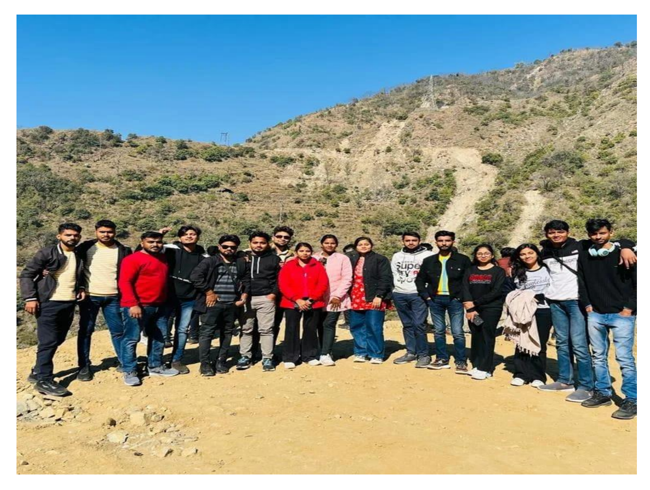
B.Pharm, 8<sup>th</sup> sem Students standing in Manali route