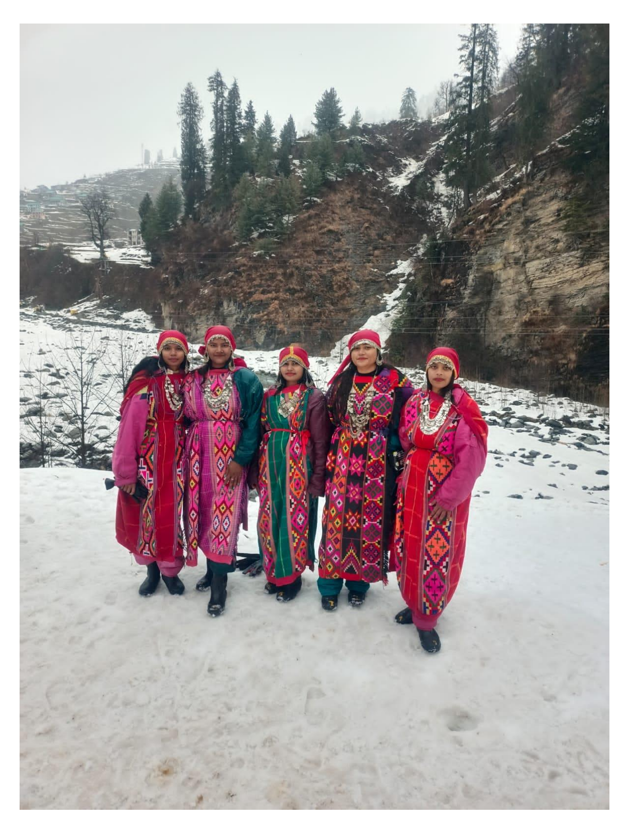
B. Pharm, 8<sup>th</sup> sem students wearing Himachali traditional wearing,