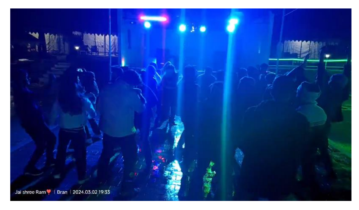
B. Pharm, 8<sup>th</sup> sem students enjoying DJ nite in camp at Kullu