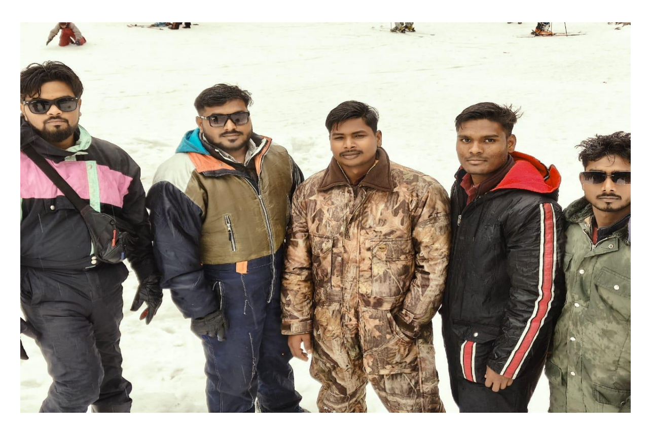
B. Pharm, 8<sup>th</sup> sem students enjoying on snow at Manali