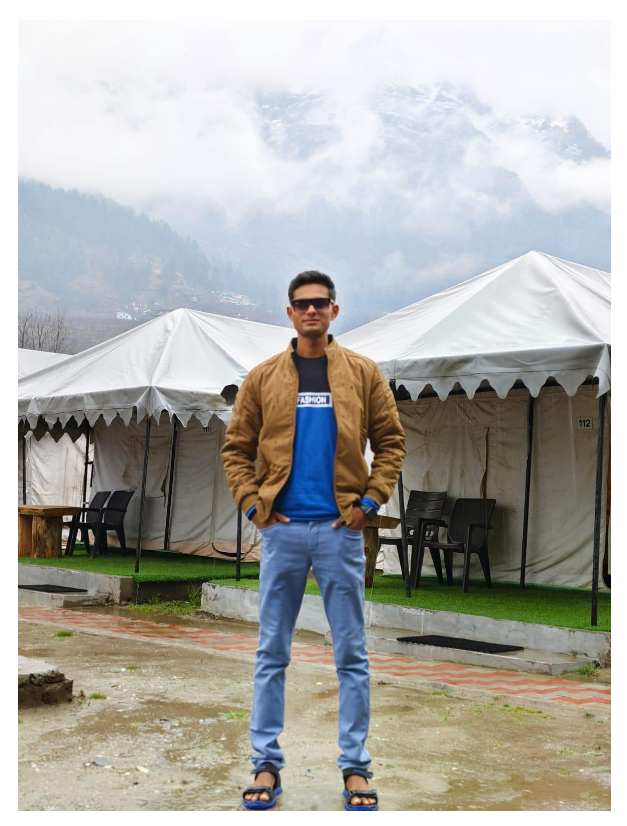
B. Pharm, 8<sup>th</sup> sem student in camp at Kullu